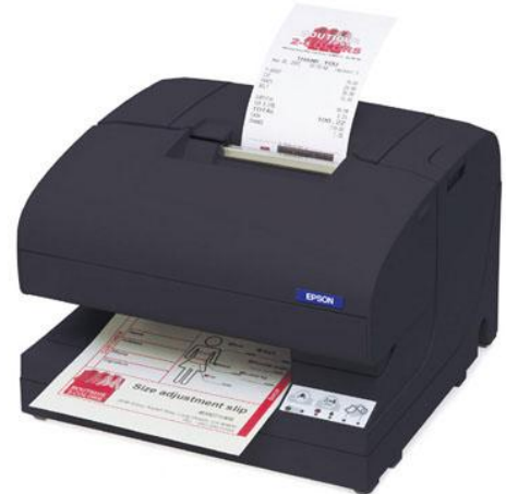
Auch in „EPSON dark grey“ eine zukunftssichere Investition

Die separaten Farbtanks des TM-J7600 sparen noch zusätzlich Geld, da jede Patrone bis auf den letzten Tropfen genutzt wird. Und – ein entscheidendes Plus für die Tintenstrahltechnologie im Vergleich zum Thermobon: Der Tintenstrahl-Bon auf Normalpapier ist absolut lichtbeständig und dauerhaft haltbar. Für den Endkunden ist das von großer Bedeutung, wenn er die Bons für Steuererklärungen aufbewahren muss. Denn - so berichtet z.B. das „Gastgewerbe-Magazin“ - Finanzämter stören sich zunehmend an eingereichten verblassten Belegen und erkennen sie womöglich nicht an. Da kann zwar auch ein Nadeldrucker Abhilfe schaffen, doch auf Grund seiner Druckgeschwindigkeit, Lautstärke und der wenig ansprechenden Druckqualität stellt er keine wirkliche Alternative dar.