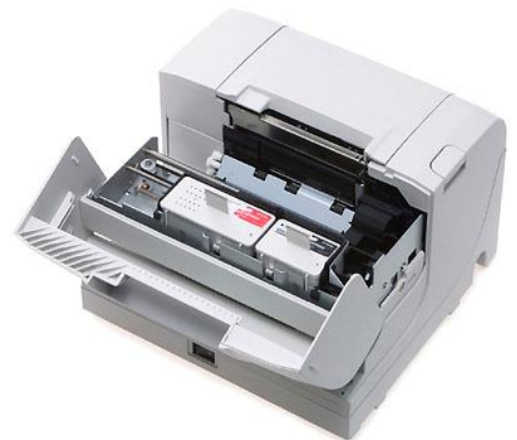
2 großvolumige Tintentanks sorgen für langes Drucken und niedrige Kosten