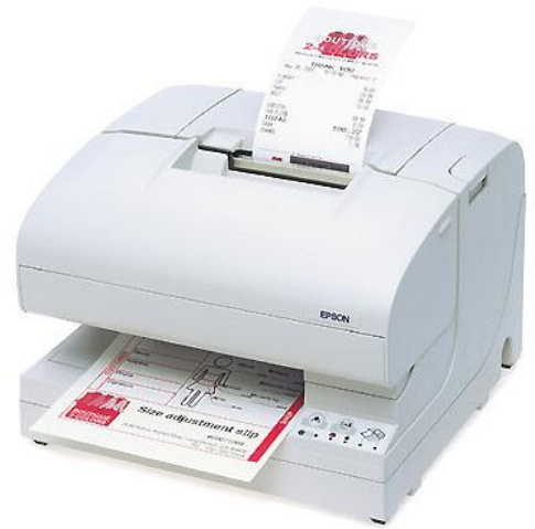
TM-J7600: brillanter 2-Farbdruck, leise, schnell, wisch- und wasserresistent

Was den Wechsel der Tintenpatrone betrifft, so ist der nur in sehr großen Abständen nötig. Denn die großvolumigen Tintenpatronen ermöglichen den Druck von bis zu 20 Millionen Zeichen bzw. 15 Mio. beim 2-Farbdruck (Economy Modus). Das entspricht in etwa der Kapazität von sechs Farbbändern beim Nadeldruck. Darüber hinaus kann der Anwender drei verschiedene Druckmodi wählen – ein Feature, das ebenso dem TM-J7000 entspricht. Je nach Einsatz stehen die Modi Fine, High Speed oder Economy zur Auswahl. Entscheidet sich der Anwender für Economy, ermöglicht ihm dieser kostengünstige Tintensparmodus besonders langen Betrieb ohne Patronenwechsel.