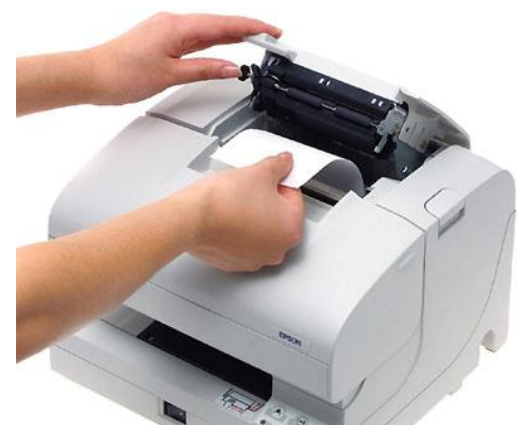
Aufklappen, Rolle einlegen, zuklappen! So einfach geht es bei allen TM-J