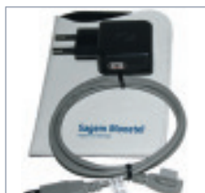
Umfangreiches Zubehör ist bereits im Lieferumfang enthalten