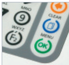
Leicht zu reinigende Folientastatur mit hervorragendem Druckpunkt