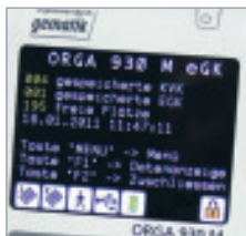
Optimale Benutzerführung durch großes farbiges Display mit Piktogrammen